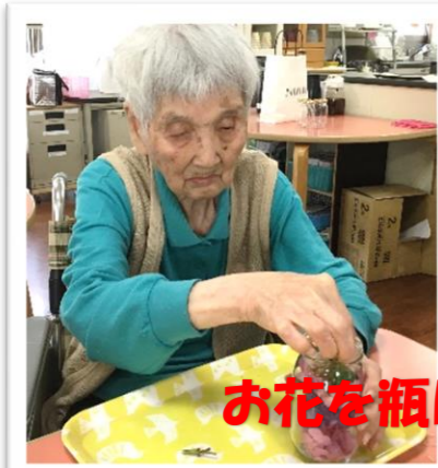
お花を瓶に詰めて詰めて