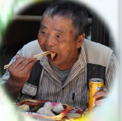
職員も一緒に頂きました。