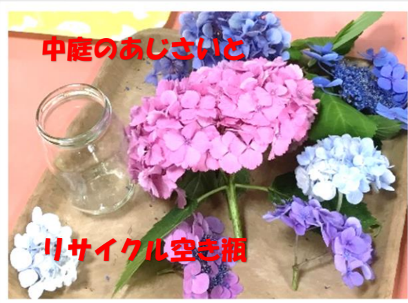
中庭のあじさいと