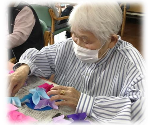
創作：玄関の壁紙作り