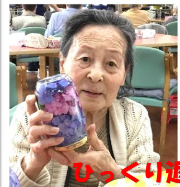
ひっくり返したらステキ♡