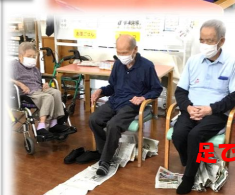
足で巻いて巻いて